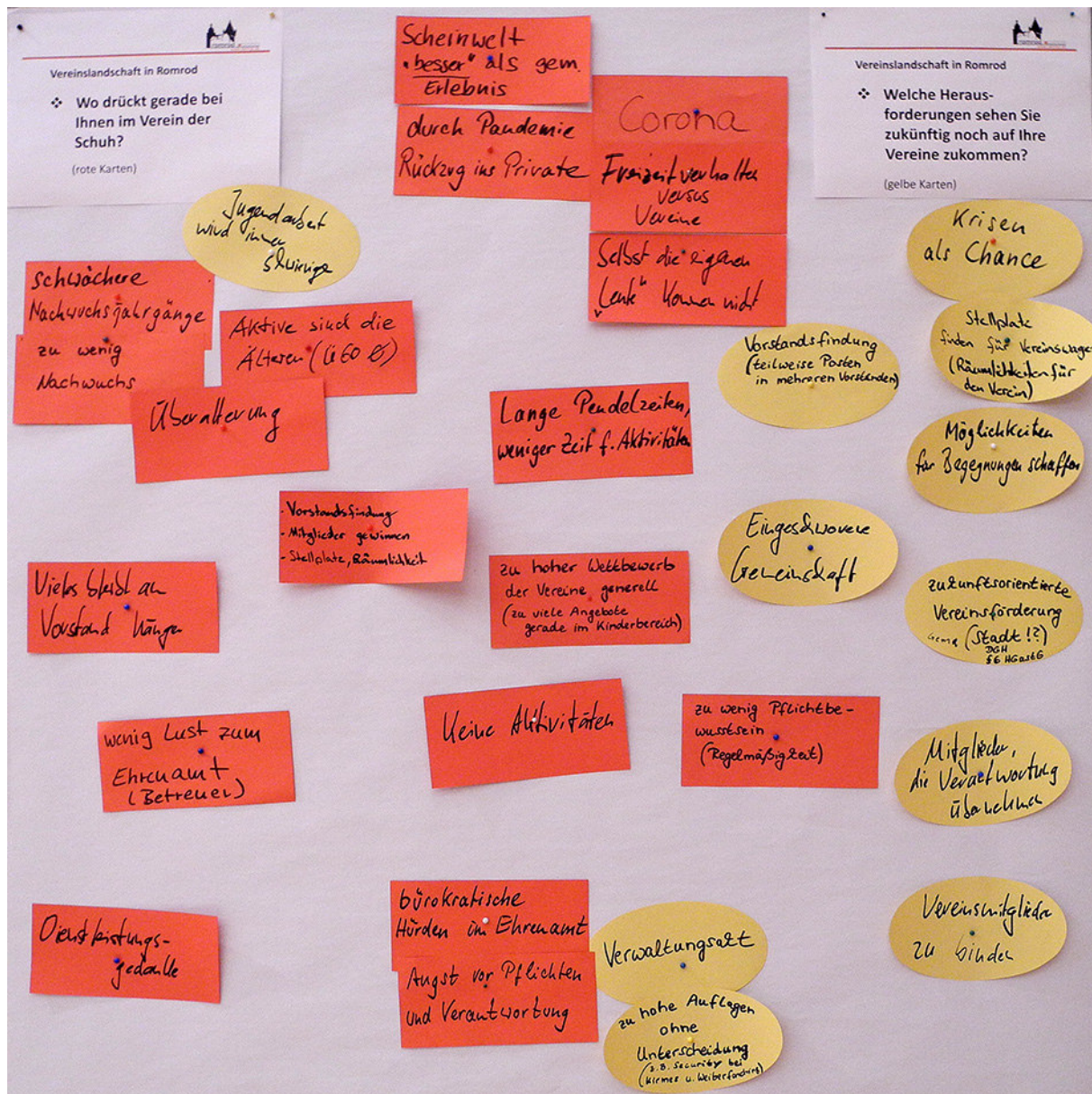
Wo drückt der Schuh: rote Karten / Herausforderungen: gelbe Karten